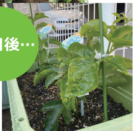
パッションフルーツ