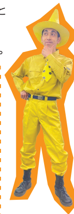
黄色い帽子のおじさん おさるのジョージ

なりきりポイントはトレードマークの帽子です。実はこの帽子、みんなには内緒でしれーっと工場の井上さんに、フルオーダーして作ってもらったものでした。当初なかなか帽子がうまく作れず井上さんに相談したところ、想像をはるかに超える出来栄えであっという間に作ってくれました。ぜひ、実物を見てもらいたいクオリティですのでご紹介します。