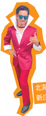
BIGBOSS (ビッグボス) 北海道日本ハムファイターズ 新庄剛志監督