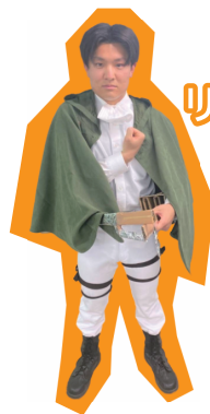
リヴァイ兵長 進撃の巨人

予想外に顔のパーツが重くなってしまう、地面に寝て手助けしてもらいながらの撮影となりました。