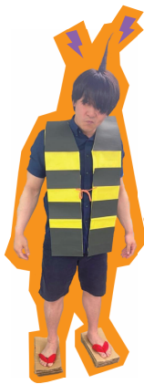
鬼太郎 ゲゲゲの鬼太郎