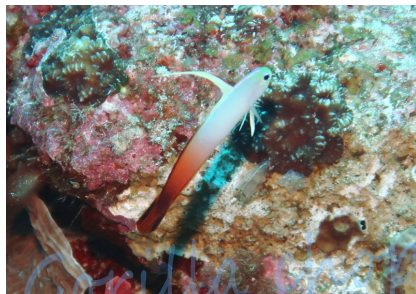
ゴリラチヨップ 崎本部緑地公園 辺野古 大浦湾