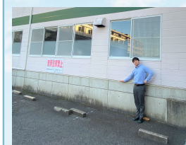
本社の基礎は私の腰くらい

ワカバ本社も同様に高い基礎の上に建物があるため、この急こう配の坂ができたというわけです。平成30年7月の西日本豪雨の時、本社前の道路は私のひざ上ぐらいまで冠水し、同じ町内では水没した車もありました。その状況下、何事もなく無事だったのはこの坂のおかげです。こんなに急でなくても感じていた坂でしたが、私たちを守ってくれる大切な坂でした。