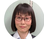
経 理 南

先の見えない状況に不安が募りますが、楽しむことを忘れずにいたいですね。 (ワカバ新聞係)