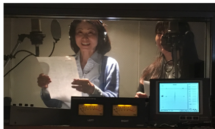
紙がゆれる音まで入る高性能なマイク