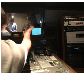
この合図で読み始めます

中国放送・RCCでラジオCMが流れるようになり、「ワカバさん！ラジオで聴くよー！」とか「社名が変わったんよね。」と、いろいろな方に声をかけていただけるようになりました。そこで、社名変更をお知らせする内容だったCMを作り変えることに。これまでのCMも社員全員で作っていましたが、メインの部分は1人の声でした。今回は全てのパートをみんなで分けて収録しました。