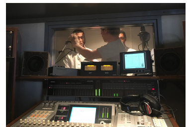
声があっすぐ入るようマイク位置を調整

イントネーションや声のトーンに気をつけて練習し挑みました。「さあ！練習もしたしバッチリ！」と向かったものの、スタジオの雰囲気緊張。「もう少し明るい感じで。」とお願いされました。いつの間にか顔が引きつっていたようです。ヘッドホンから聞こえる自分の声に違和感を感じながらも、楽しくやっているうちに終了。いつも聴いているラジオに自分の声に乗るなんて今から楽しみです。まだ確認していませんが、今回は誰の声か判別できると思うので、ぜひ中国放送 RCCラジオを聴いてみてください。