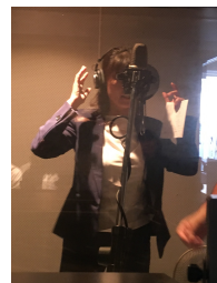
次は私の順番ですね