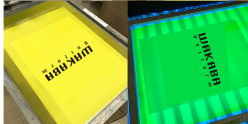
両面に乳剤を塗布したら光をあてる

光（紫外線）をあてると、黒い部分だけインクを通すように穴があきます。型の完成です。