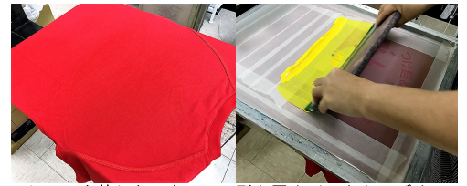
Tシャツを枠にセット 型を置きインクをのぼす

2色なら2回、3色なら3回と色の数だけ繰り返します。そのため、色数だけ型が必要です。