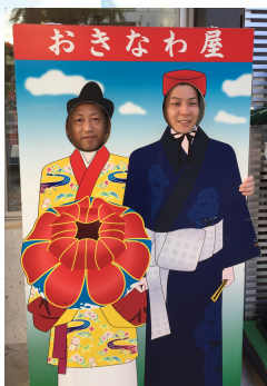
旅行に来たらやっぱりかかないとね