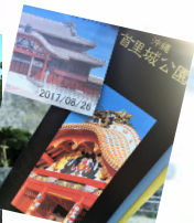
首里城で歴史も学びました