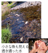
小さな魚も見える透き通った水