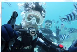
最近ライセンスを取得した社長の余裕のピース