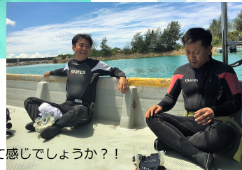
『海の男！』って感じでしょうか？！