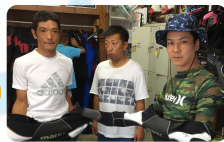
初体験を前にしたそれぞれの表情に注目です。ドキドキの表情です。